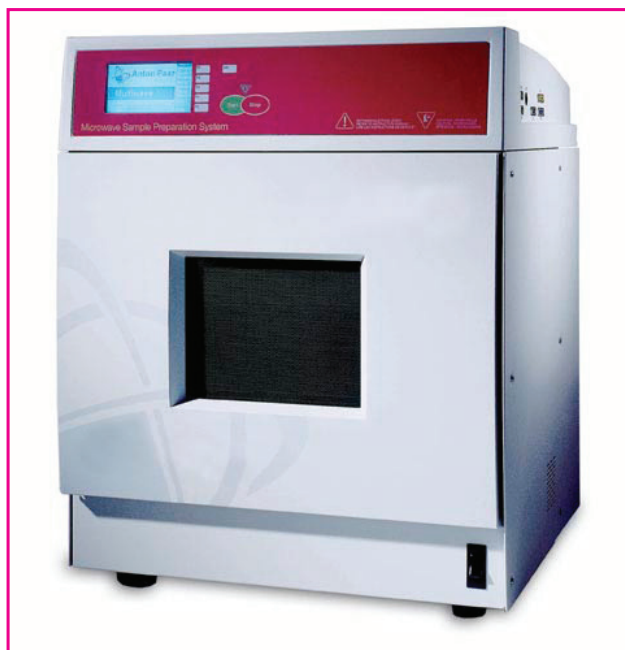
شکل ۱: نمونه‌ای از یک دستگاه ماکروویو

سپس ۱۰ میلی‌لیتر نیتریک اسید، ۲ میلی‌لیتر آب اکسیژنه به آن اضافه می‌کنیم و دوباره حرارت می‌دهیم. در انتها محتویات بشر را به یک بالن ۱۰۰ میلی‌لیتری منتقل نموده و با آب یون‌زدایی شده به حجم می‌رسانیم. در صورتی که نمونه احتیاج به صاف کردن داشته باشد آن را با کاغذ صافی واتمن ۴۲ صاف می‌کنیم. این نمونه آماده خوانش با دستگاه پلاسما جفت شده القایی - نشر اتمی است [۱۰].