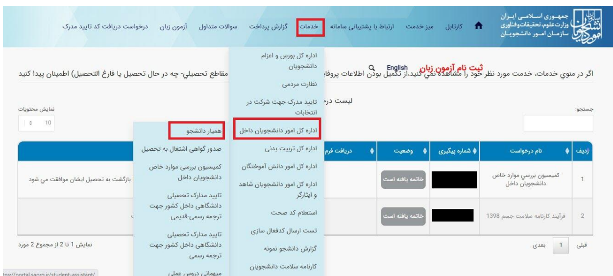
تصویر ۱ - انتخاب فرایند همیار دانشجو در پورتال

از جمله فرآیندهای اداره دانشجویان داخل، ثبت درخواست همیار دانشجو است. متقاضی قبلا در پورتال سامانه جامع امور دانشجویان (سجاد) ثبت نام کرده و نام کاربری و رمز عبور دریافت نموده است و پس از ورود به پورتال درخواست فوق را از سربرگ خدمات، بخش امور دانشجویان داخل، گزینه همیار دانشجو را انتخاب و اقدام به ثبت درخواست می کند (چنانچه دانشگاه مورد نظر در لیست دانشگاه های تعریف شده در سامانه نباشد پیغام اخطار تصویر ۳ نمایش داده می شود). پس از ثبت درخواست و دریافت کد پیگیری توسط متقاضیانی که امکان مشاهده و ثبت این درخواست را دارند، درخواست توسط کارشناس مسئول همیاران دانشجو هر دانشگاه، بررسی می شود و در صورت تایید یا عدم تایید درخواست ها، وضعیت فرایند در پورتال به "خاتمه یافته" تغییر پیدا خواهد کرد و متن مناسب در بخش توضیحات به متقاضی نمایش داده خواهد شد. (تصاویر ۱ و ۲)